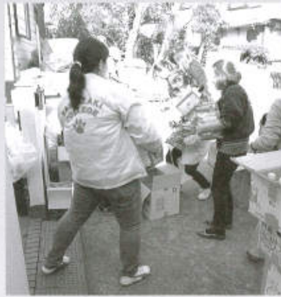
◀緊急災害時動物救援本部に届いた支援物資の仕分け作業に協力

た真心がこもる支援物資の仕分け作業などにも、当支部および学園を挙げて積極的に取り組んでおります。先日の集荷場の移設の際は、20トンもの物資を数回に分けて運び込む作業も行いました。今後は被災動物の救援・保護活動や、譲渡活動などの支援準備をしています。長期化に伴い支援状況も変化することが予測されます。本部の呼吸に合わせた息の長い支援活動を目指して参ります。