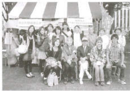
横浜支部の推進員とボランティア (9月26日「動物愛護フェスタよこはま」にて)

支部創立34年目となり、「新しい飼い主探しの会」を、今年も毎月第三日曜日に兵藤動物病院の駐車場で、日本大学(生物資源科学部 VAC サークル)の学生・ヤマザキ動物看護短期大学(ボランティアサークル JAL)の学生・一般ボランティアで、毎回20~25名が参加して行いました。終了後には、勉強会及び支部役員会を開催しています。又、電話相談も年間99件受け付けました。