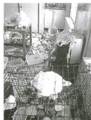
動物取扱業者の施設

正の場合には、動物福祉に沿った形でこれらの問題が速やかに解決できるよう尽力したいと思っております。